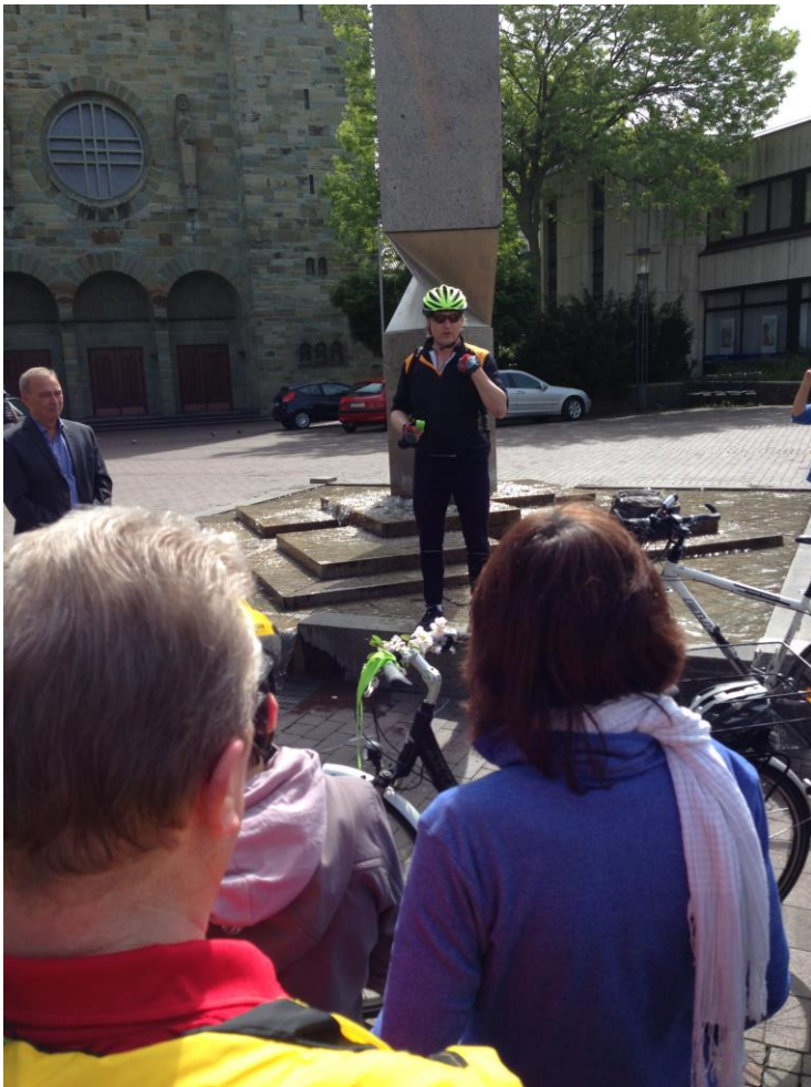
...letzte Informationen durch Herrn Wülfing