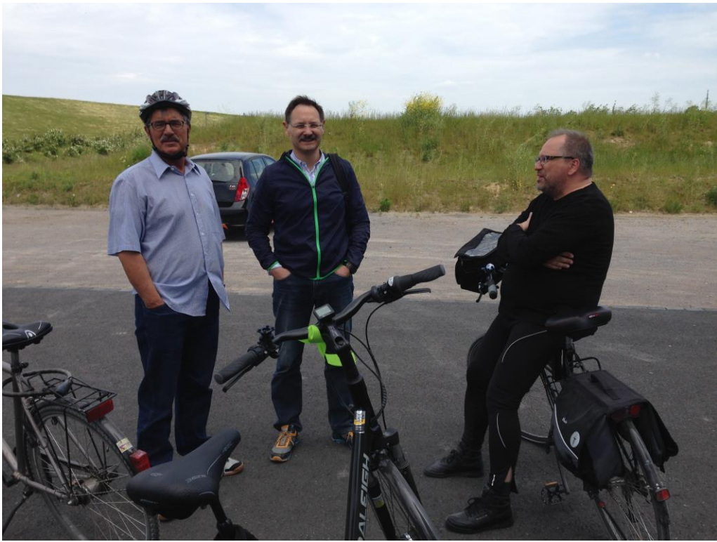
Pause am Förderturm Schacht Königsborn