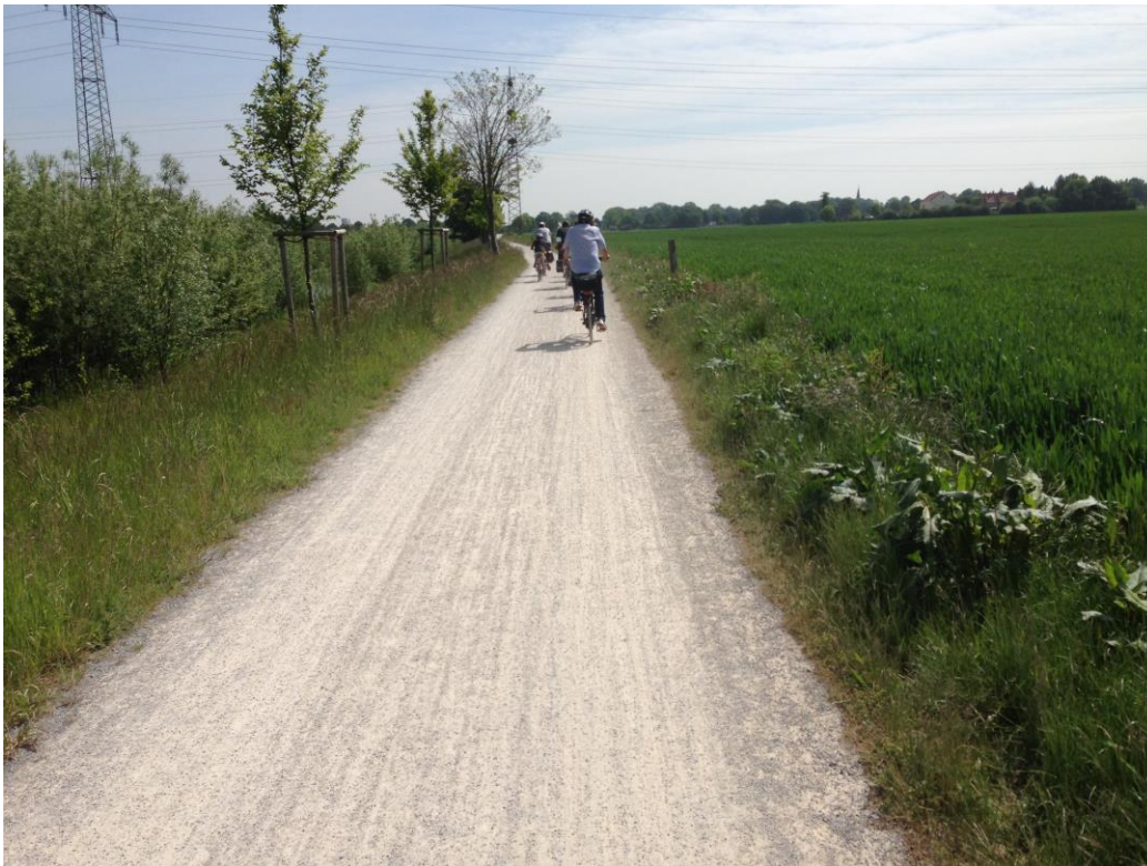
...entlang der Seseke