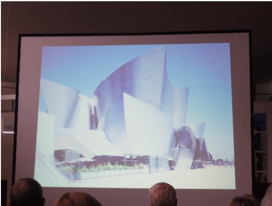
ein spannendes Bauwerk, die Walt Disney Concert Hall, Los Angeles