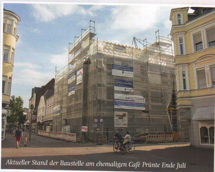
Aktueller Stand der Baustelle am ehemaligen Café Prünste Ende Juli

Trotzdem klingt das nach einer Kapitulationserklärung der Lokalpolitik: Bitte, lieber Bauherr, mach es