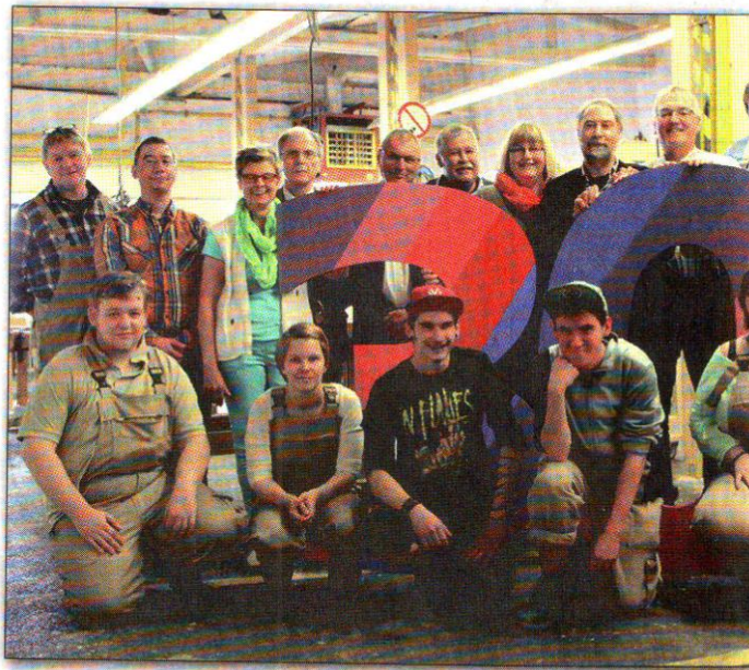
Der Aufsichtsrat der Werkstatt zog eine Bilanz von 30 Jahren - hier mit Teilnehmern in den Unternehmen.

Inzwischen ist das Angebot schon mehrfach kopiert und von der Bundesagentur für Arbeit als „Berufsvorbereitung Pro“ zum Regelangebot für Jugendliche geworden, die in anderen Bildungseinrichtungen keine Perspektive fanden.